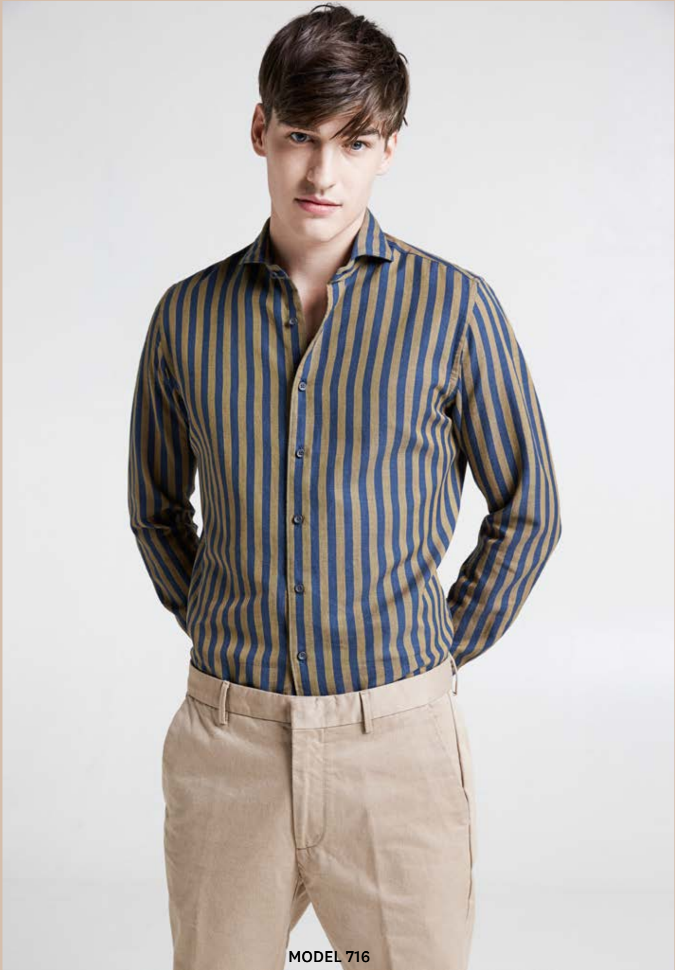
MODEL 716 ARTICLE 71223