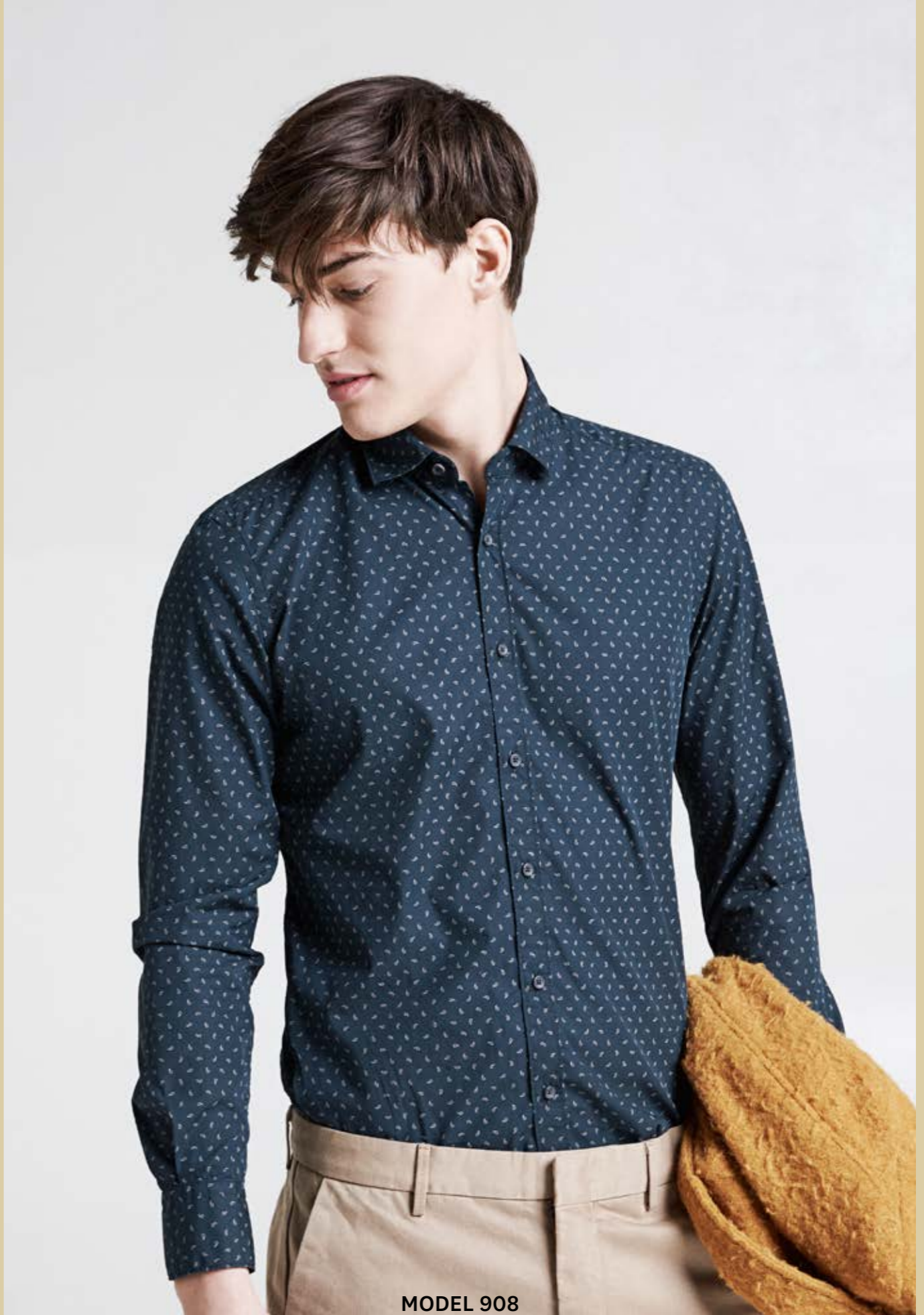
MODEL 908 ARTICLE 71519