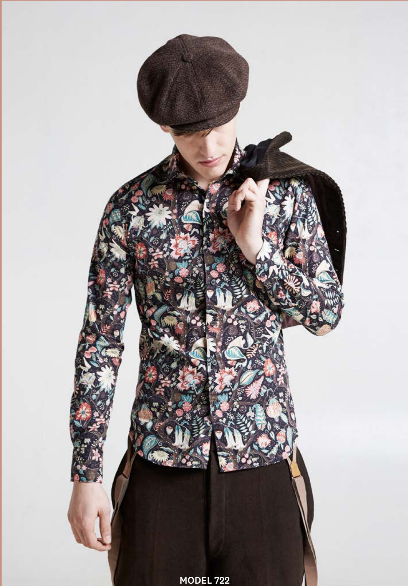
MODEL 722 ARTICLE 71526