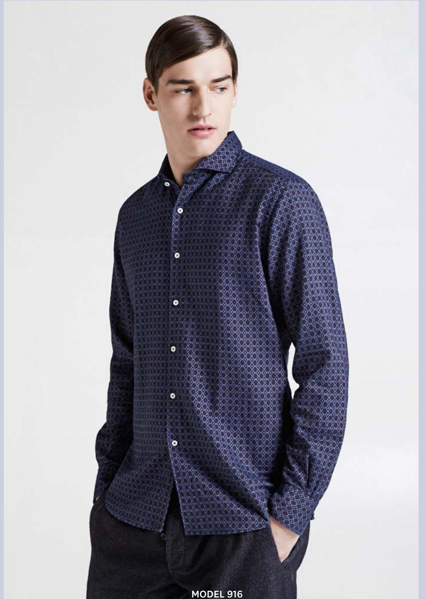
MODEL 916 ARTICLE 71514