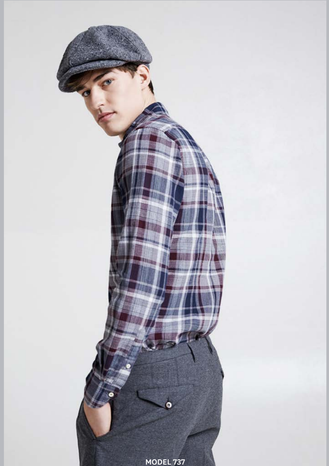
MODEL 737 ARTICLE 71343