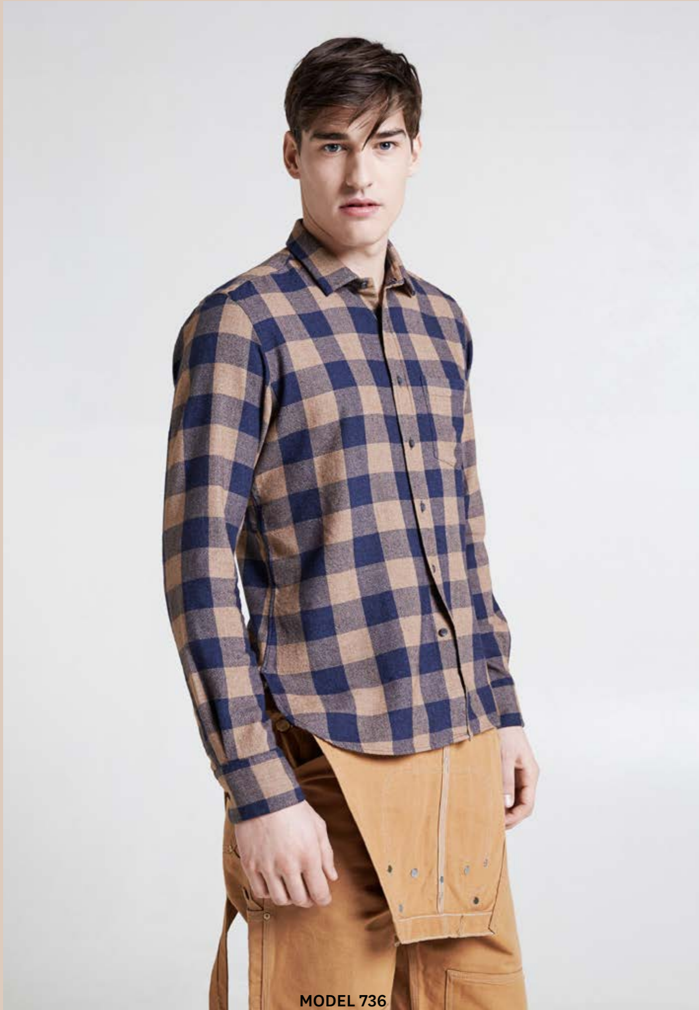
MODEL 736 ARTICLE 71314