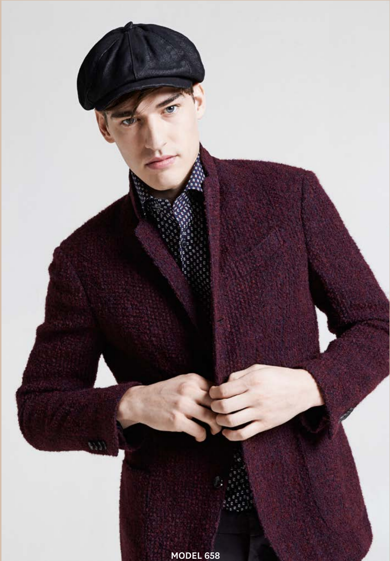
MODEL 658 ARTICLE 71531