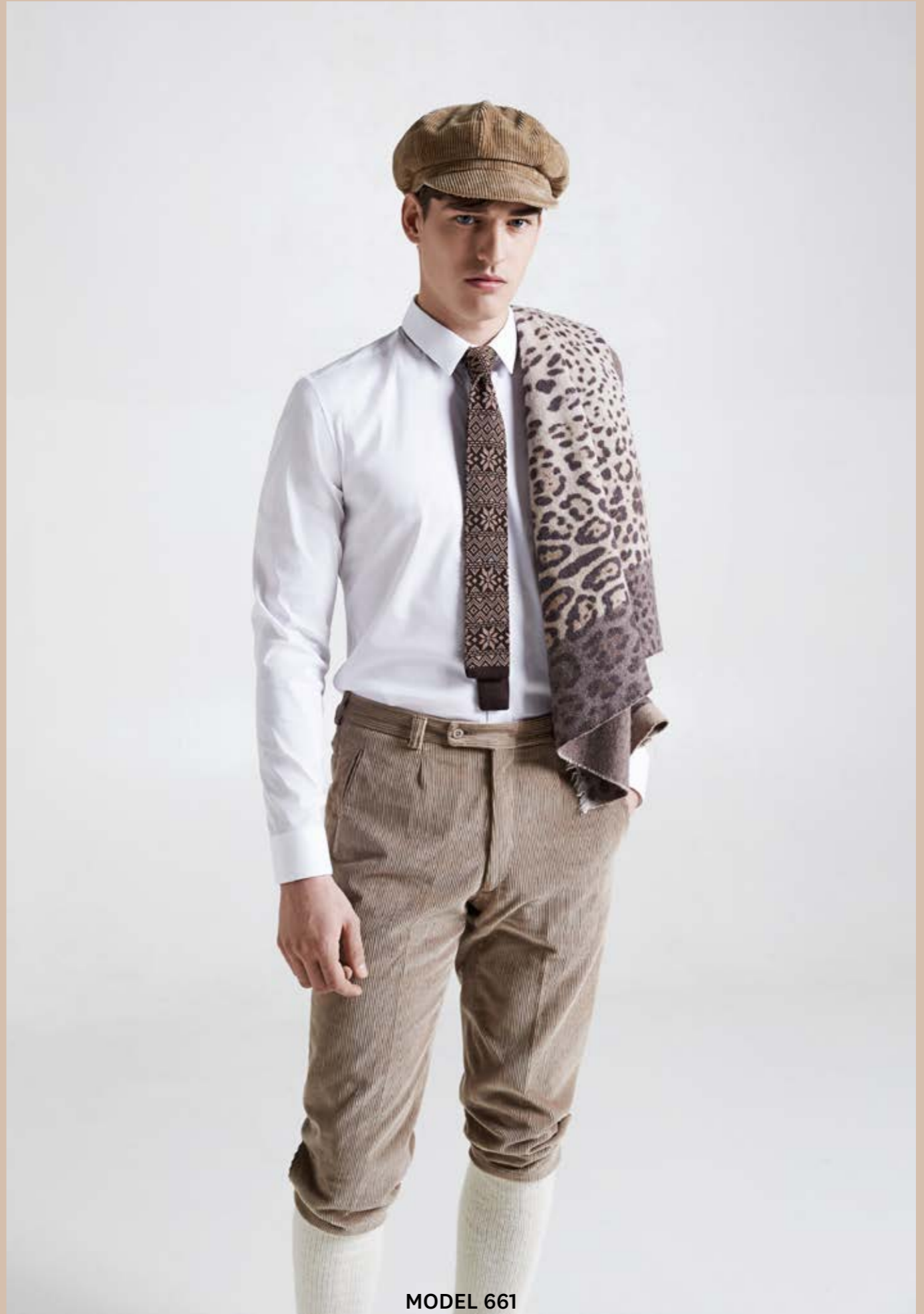
MODEL 661 ARTICLE 16125