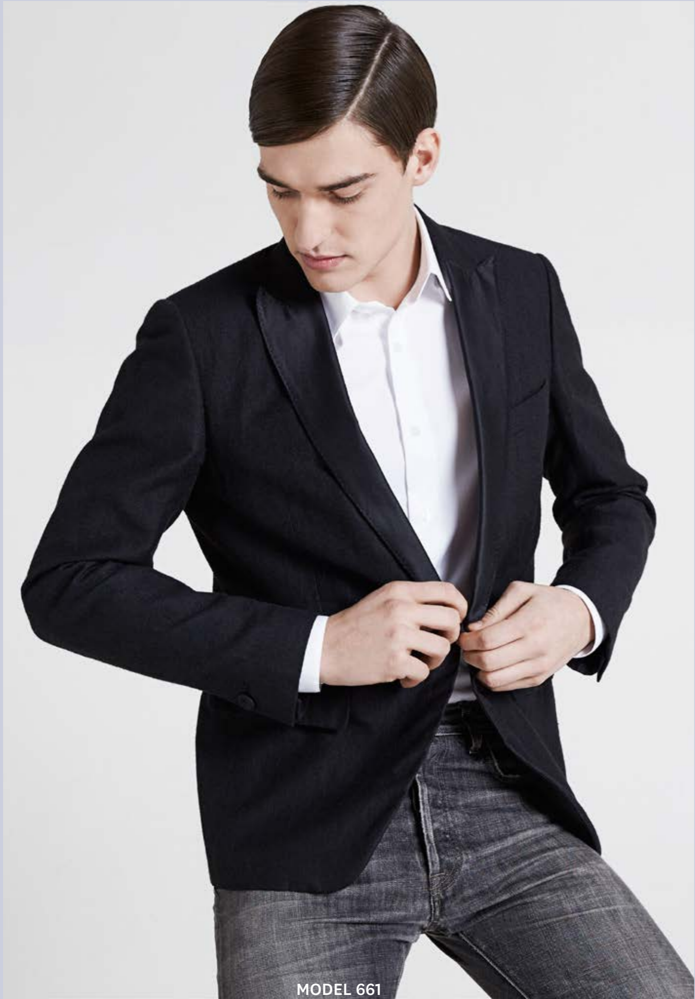
MODEL 661 ARTICLE 16125