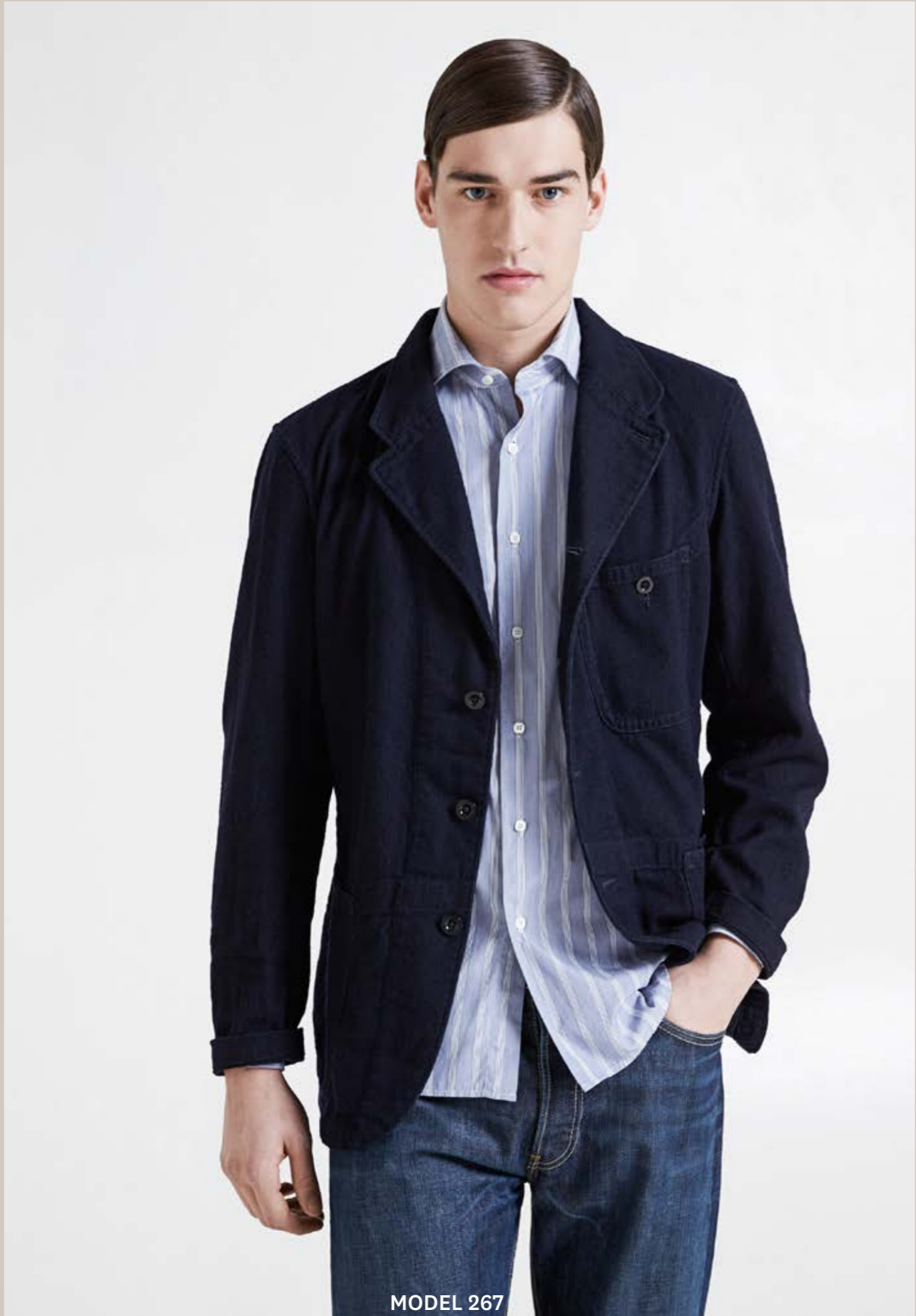
MODEL 267 ARTICLE 71226