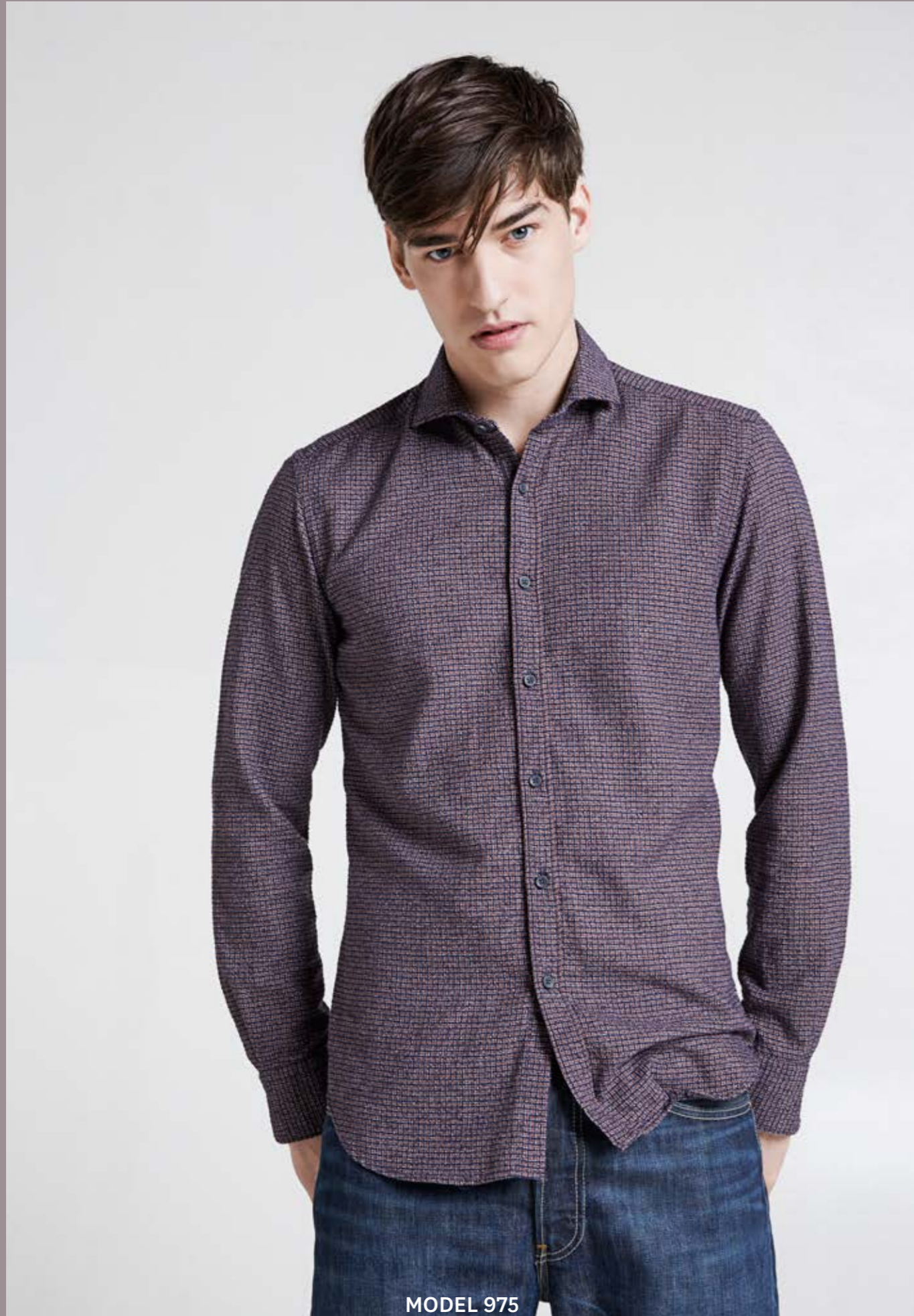
MODEL 975 ARTICLE 71317