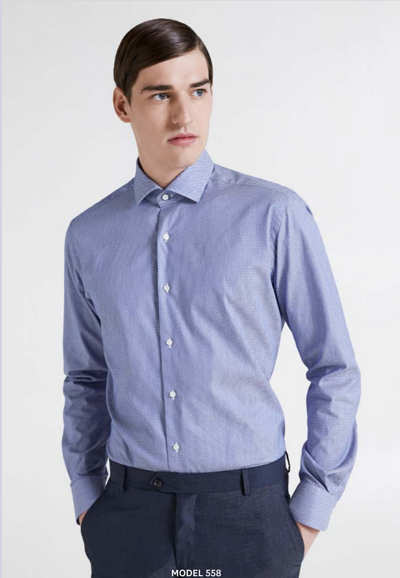
MODEL 558 ARTICLE 71105