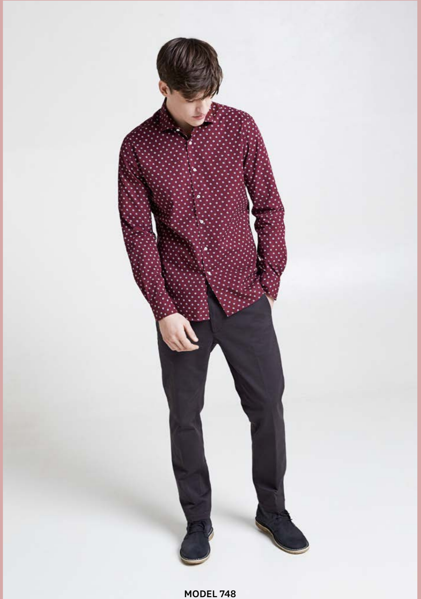
MODEL 748 ARTICLE 71522