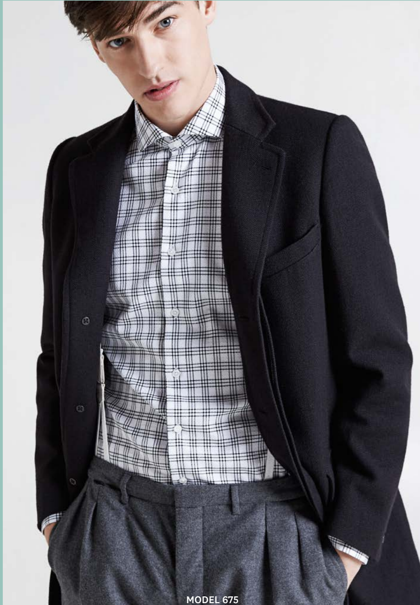
MODEL 675 ARTICLE 71308