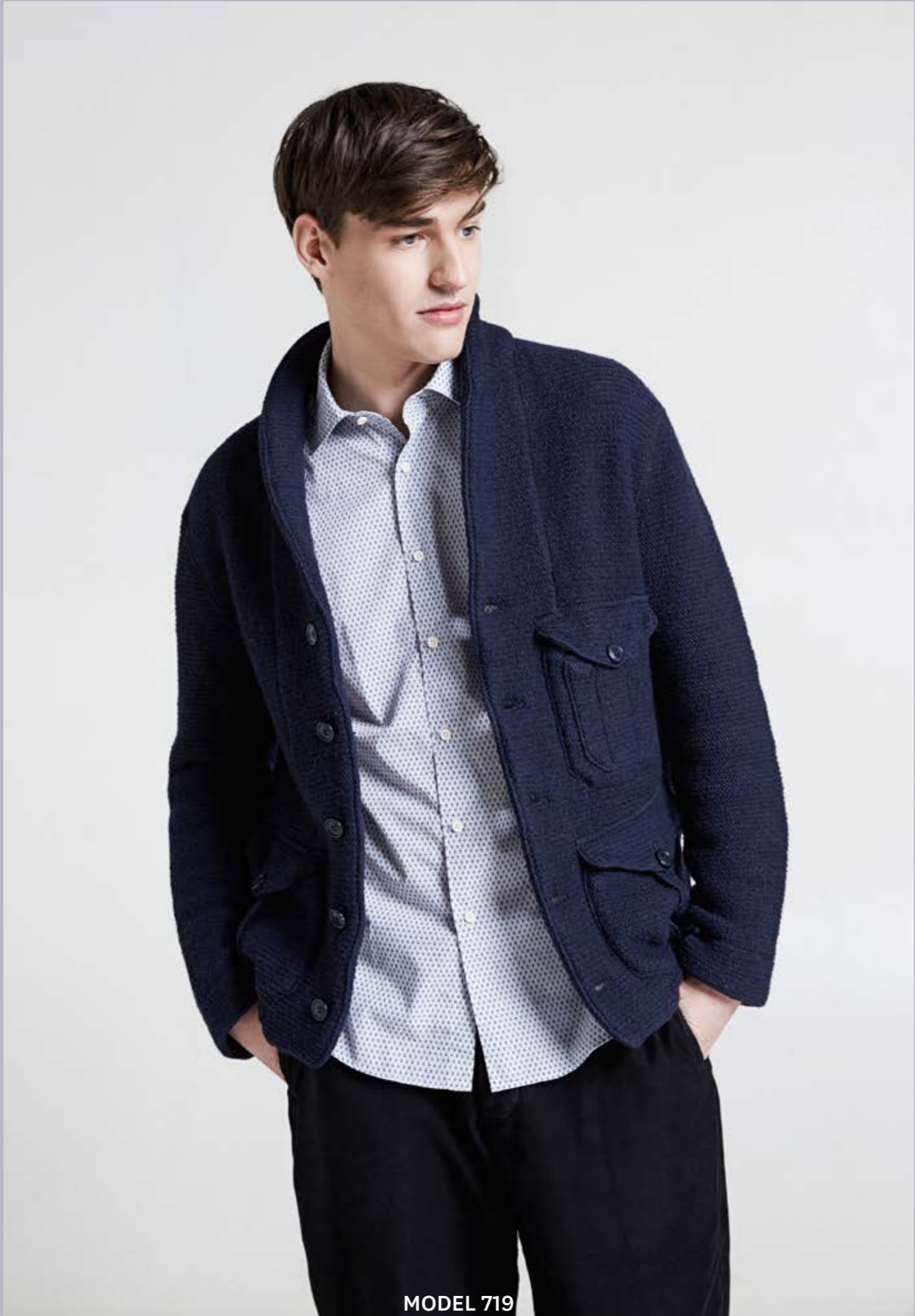
MODEL 719 ARTICLE 71527