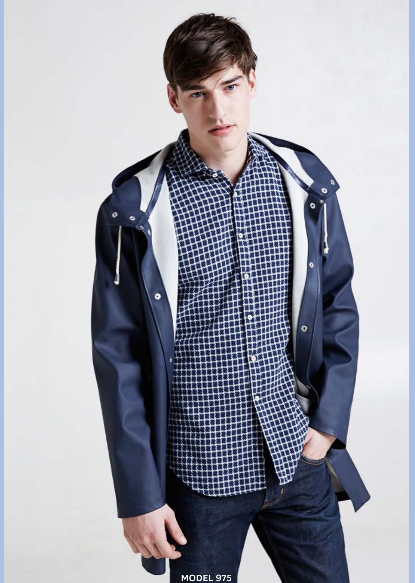
MODEL 975 ARTICLE 71305