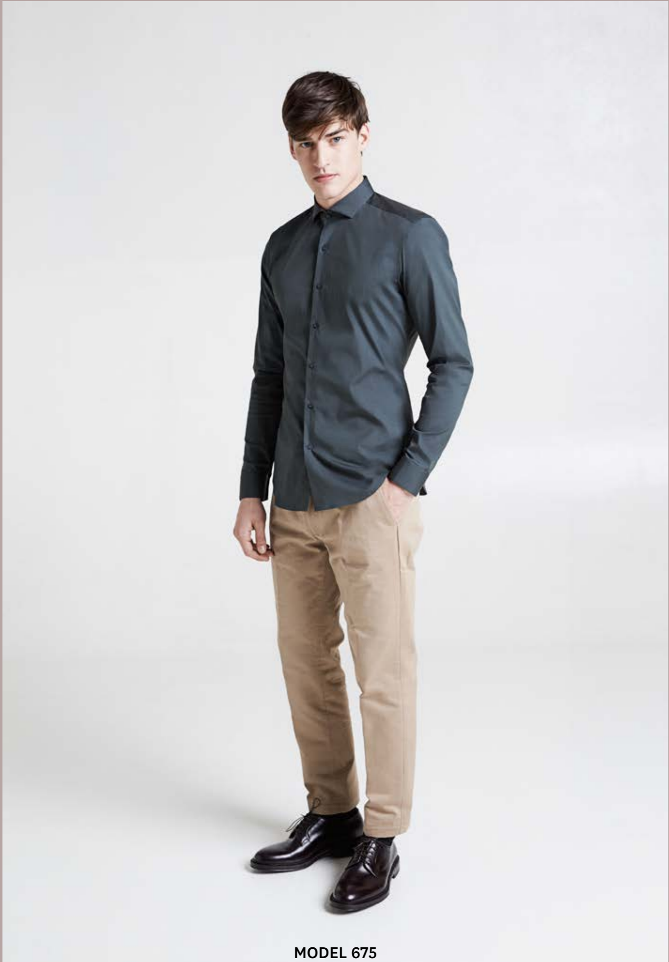
MODEL 675 ARTICLE 16125