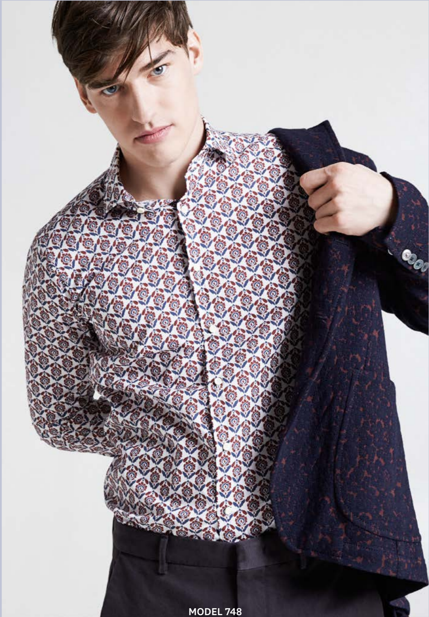
MODEL 748 ARTICLE 71524