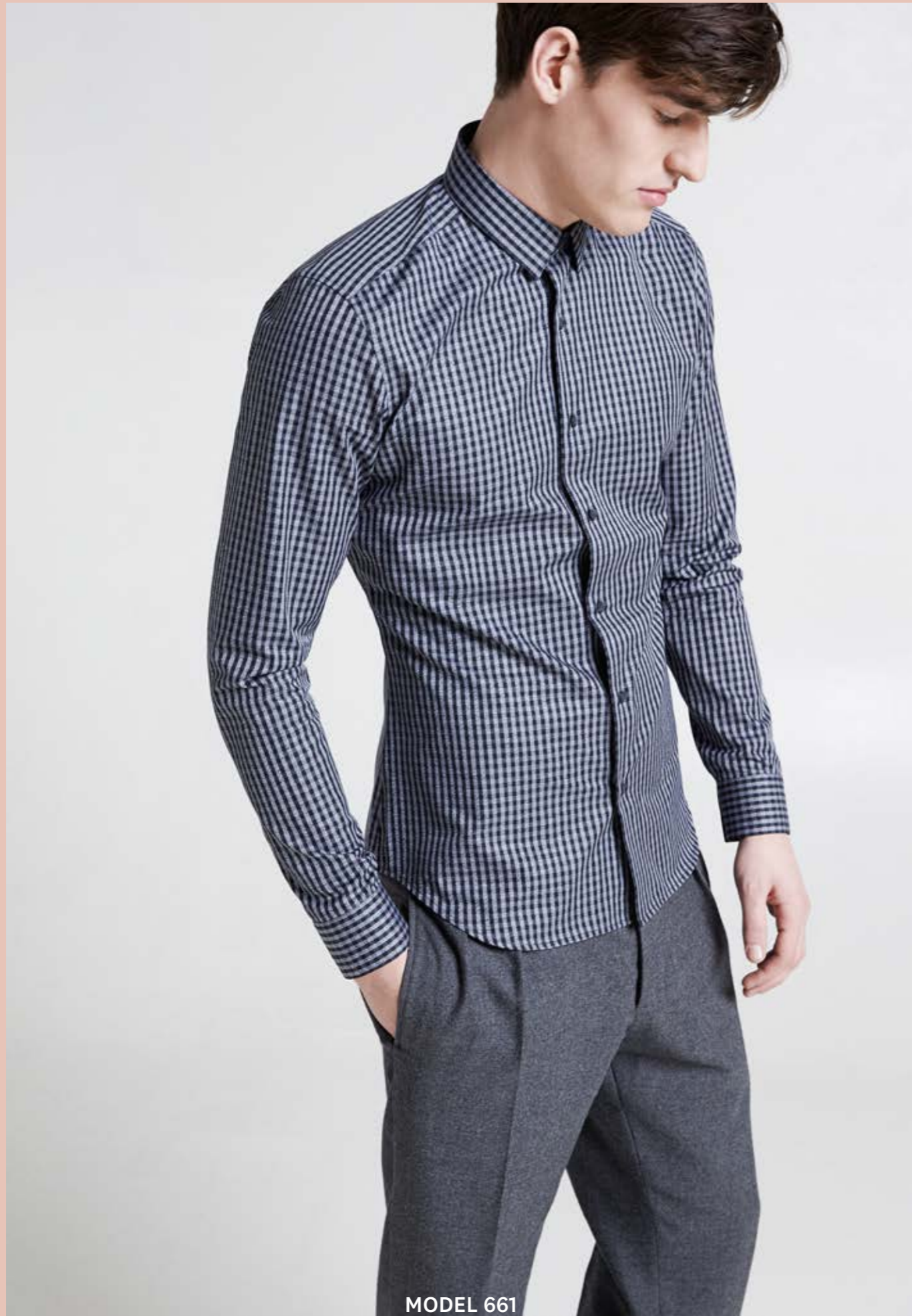
MODEL 661 ARTICLE 71309