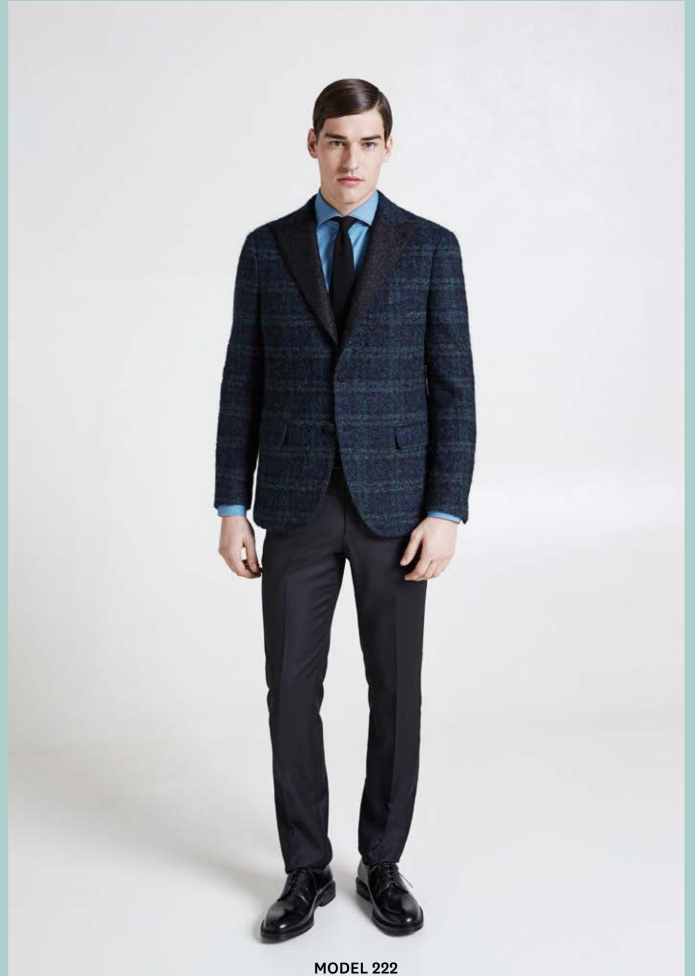
MODEL 222 ARTICLE 71143