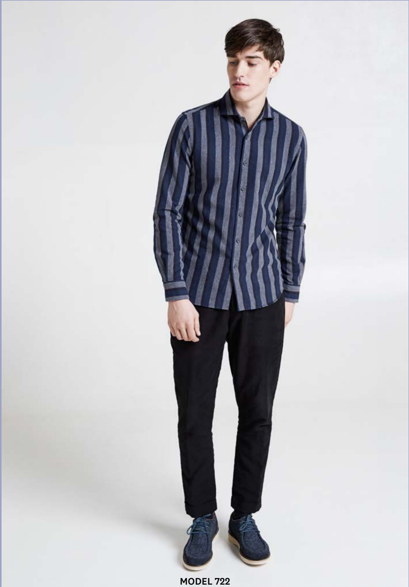
MODEL 722 ARTICLE 71231