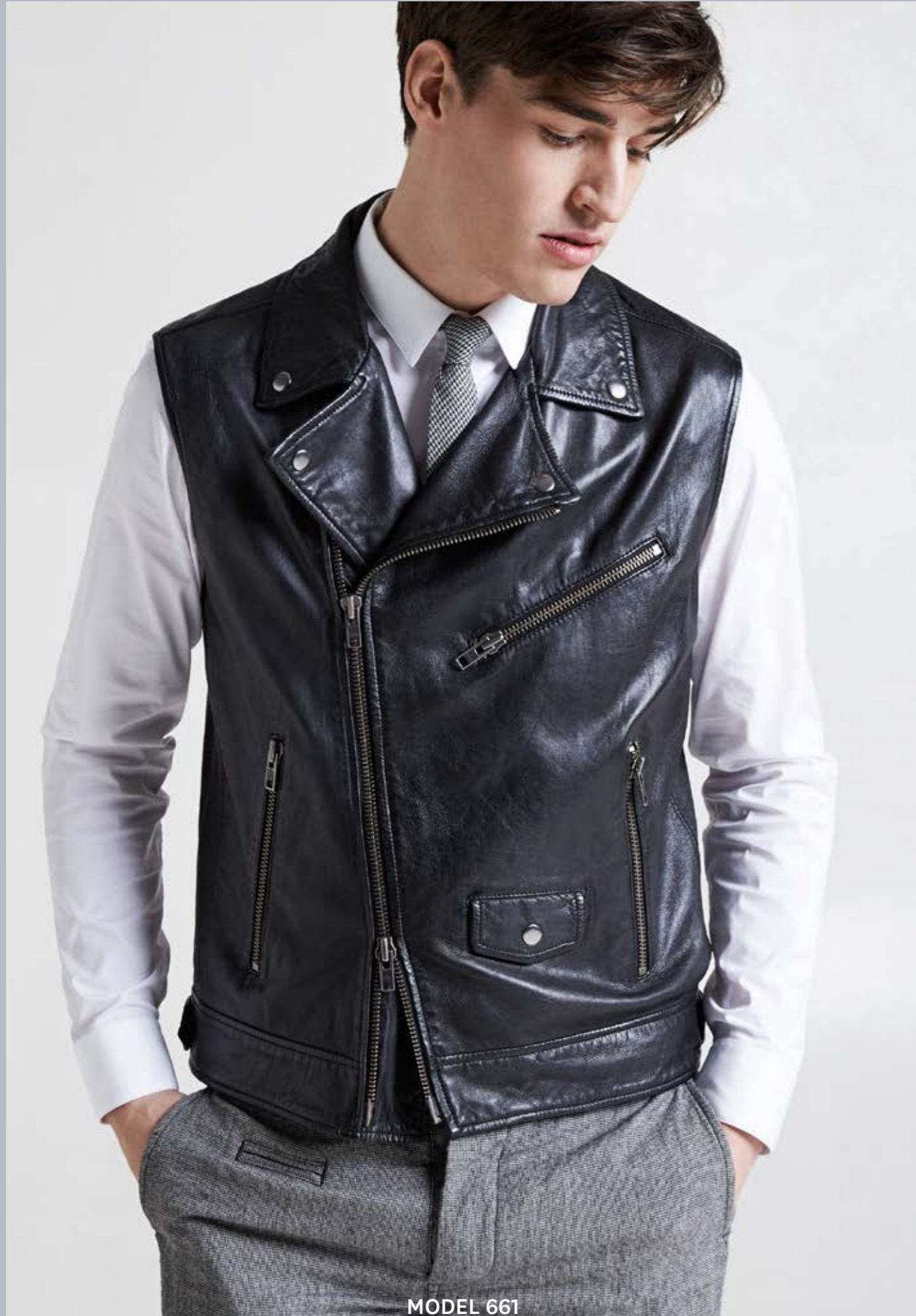
MODEL 661 ARTICLE 16125