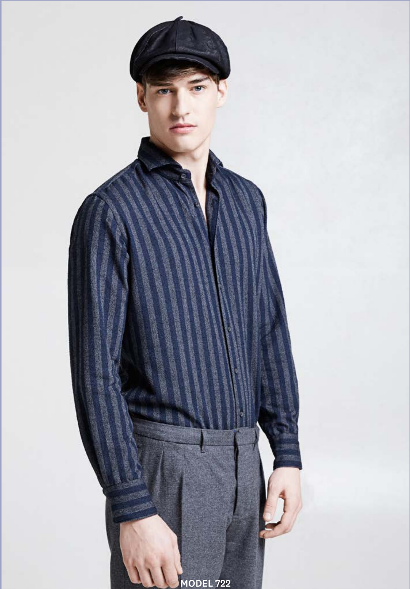
MODEL 722 ARTICLE 71224