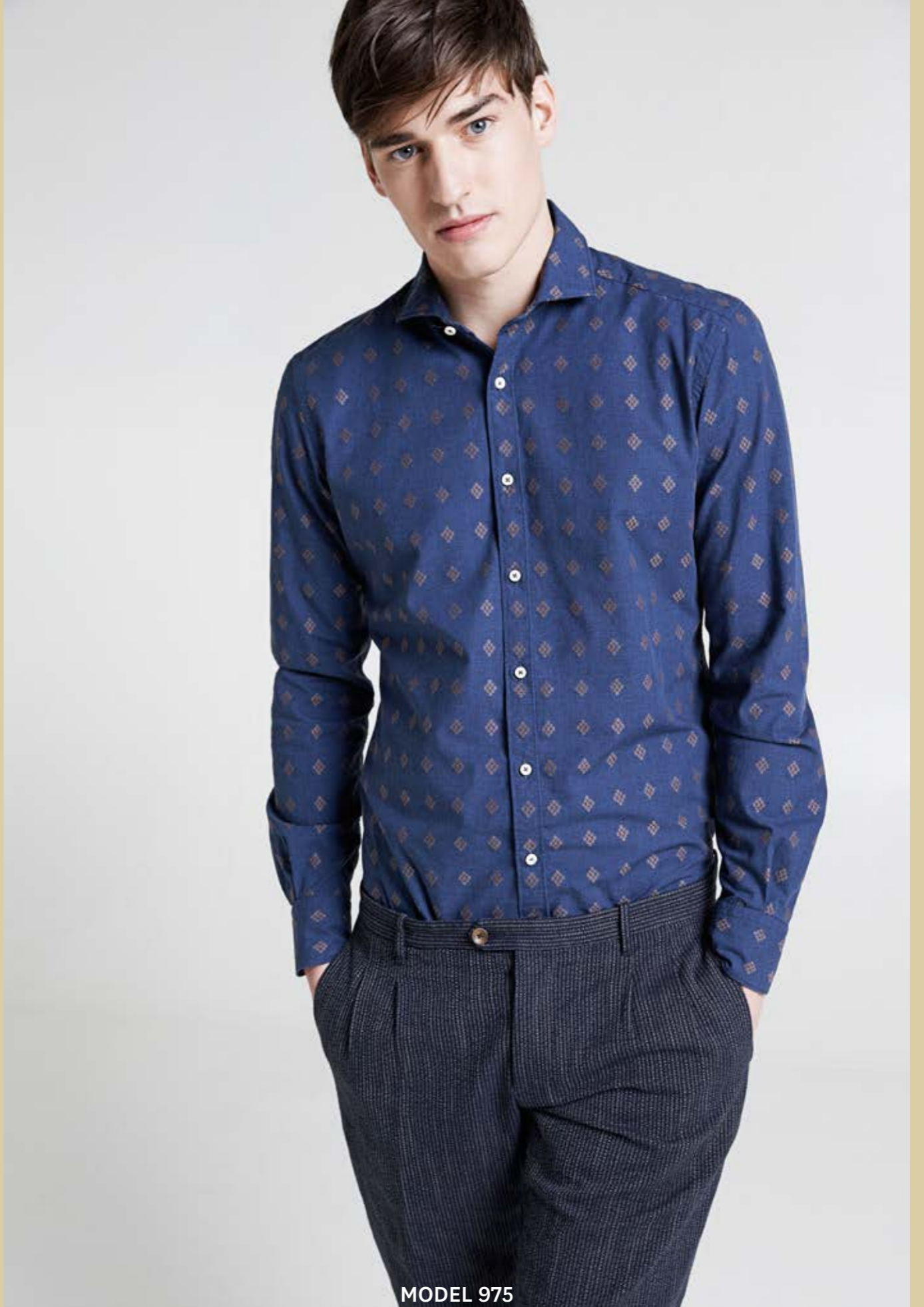
MODEL 975 ARTICLE 71420