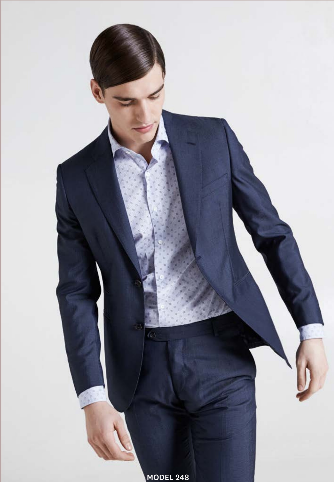
MODEL 248 ARTICLE 71505