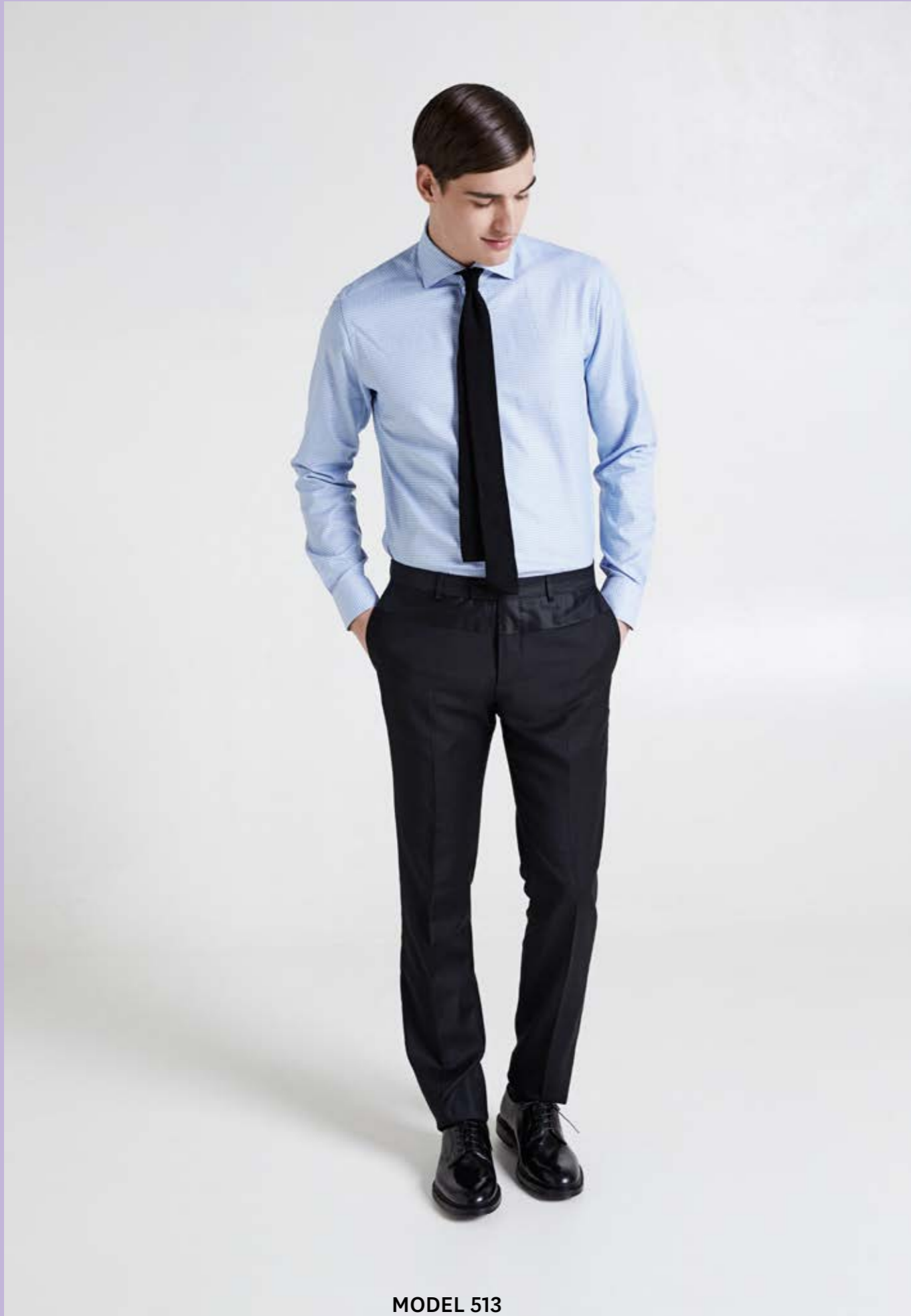
MODEL 513 ARTICLE 71315